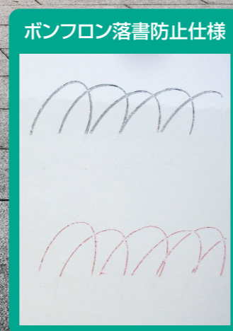
※油性マジックの下部を布にて空拭きした後の状態